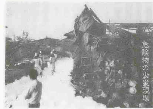
危険物の火災現場

一般に危険物というものは、燃えやすい、こみやく、ガラスの破片なども含まれませんが、消防法でいう危険物とは、ガソリン、シンナー、灯油など発火性、引火性のものをいいます。中でもガソリン、灯油等日常生活の必需品として使われるものが多い。その量が多ければ、それだけ大きな災害につながります。 そこで、法律によって指定数量(危険度のめやす)が定められています。そして指定数量以上の危険物は、貯蔵所以外の場所での貯蔵や製造所、貯蔵所および取扱所以外の場所での取り扱いが禁止されています。 このほか貯蔵所、製造所、取扱所は許可を受けて設置したり、使用する前は完成検査を受けること。使用の際は危険物取扱者が立ち合うことなど、いろいろ細かい規制があります。