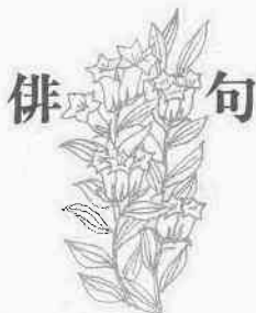
俳句クラブ たかしな

※ここに掲載したものは、最近の広報川越に載っているものばかりです。※□は不燃物の収集日です。あなたの地区の日程を確認してください。▷( )内は会場または主催者、時間は開始時間 公=公民館 (集)=集会所 ▶3歳児健診は、該当のお子さんが住んでいる地区によって会場が違ってきますから、ご注意ください。