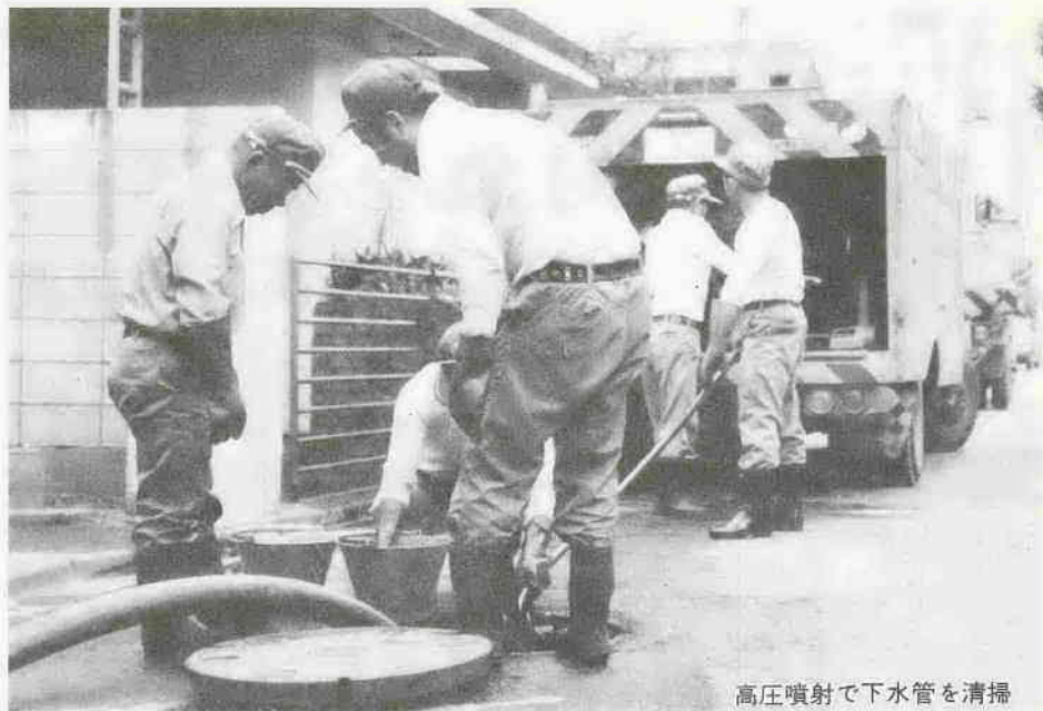
高圧噴射で下水管を清掃

九月十日は全国下水道促進デーです。下水道は、いわば市民生活の静脈で、住みよい環境づくりに欠くことのできない大切な施設ですが、わが国の普及率は残念ながらあまり高くありません。 そこで、下水道に対する国民の関心を高め、その建設を促進しようというのが下水道促進デーの目的です。九月十日は全国的に下水道に関する国民運動が展開されます。