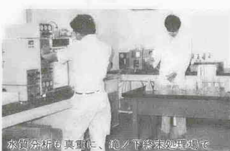
水質分析も真重に、最終処理場へ

下水道事業は非常に多額の建設費を必要とします。下水道を建設しようとする地域の土地所有者や権利者に建設費の一部を負担していただくのが、受益者負担金制度です。川越市の下水道事業は、昭和四十三年からこの受益者負担金制度を採用しています。下水道事業を促進し、住みよい町づくりのため、皆さんのご理解とご協力をお願いします。