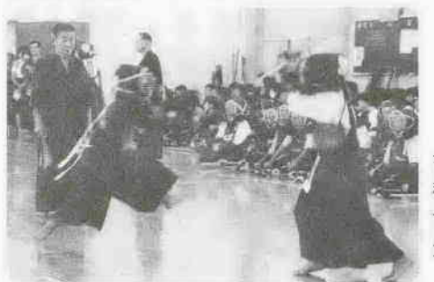
榎倉町と 交歓剣道

友好都市榎倉町から「剣士」約60人が来川、8月18日、市長に表敬訪問の後、郭町2丁目の武道館で親善試合が行われた。城主が「榎倉から川越へ国替えになったという江戸末期からの歴史をつながり、昭和47年に友好都市の盟約を結んだ川越市と福島県東白川郡榎倉町。以来、1年とない相手方へ「乗り込み、友好の太いパイプを今日根付かせるのは我々が」と、今年で8年目を迎えた。試合は、少年の部で川越の凱歌があったものの、他は榎倉勢が圧倒。翌19日、市内の名所を訪れた一行は、「来年は榎倉町で会いましょう」と誓い、帰路についた。