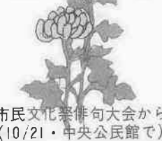
市民文化祭俳句大会から (10/21・中央公民館)