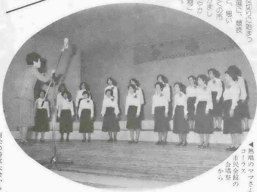
▲熱唱のママさんコーラス 市民会館の合唱祭から

9月29日・華展を皮切りに始まった市民文化祭。作品展に、競技大会に、発表会にと、思い思いの力たちが多くの市民が参加、晴れがましきこの秋にも和やかな秋の一日を過すことができました。