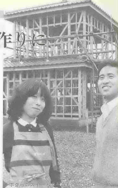
ホタラのスイートホームも市の住宅ローンで