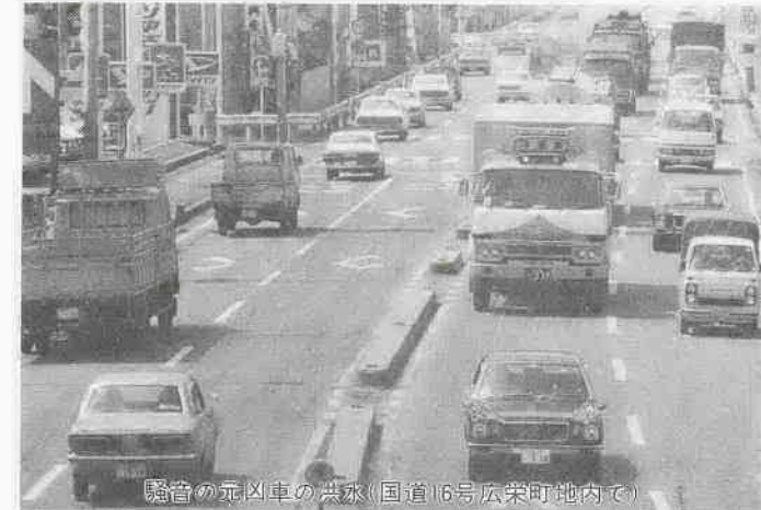
騒音の元凶車の洪水(国道16号広栄町地内)

市内の環境騒音が環境基準を超えるのは二百八か所のうち二十五か所。その主な発生源は国道一六号線を筆頭に道路交通騒音である。このほど市公害課が公表した「川越市環境騒音実態調査結果」から、こんな環境騒音の状況が明らかになりました。 騒音は、振動、悪臭とともに感覚公害ともいわれ、日常生活とも密接な関連をもっています。一昨午市に持ち込まれた公害苦情のうち四割はこの騒音に関するもの、というところでも、騒音と生活の結びつきをうかがい知ることが出来ます。 今回の環境騒音調査も、一般に静かな街というイメージが強い川越も実際は違うのでは—というところから始められたものです。