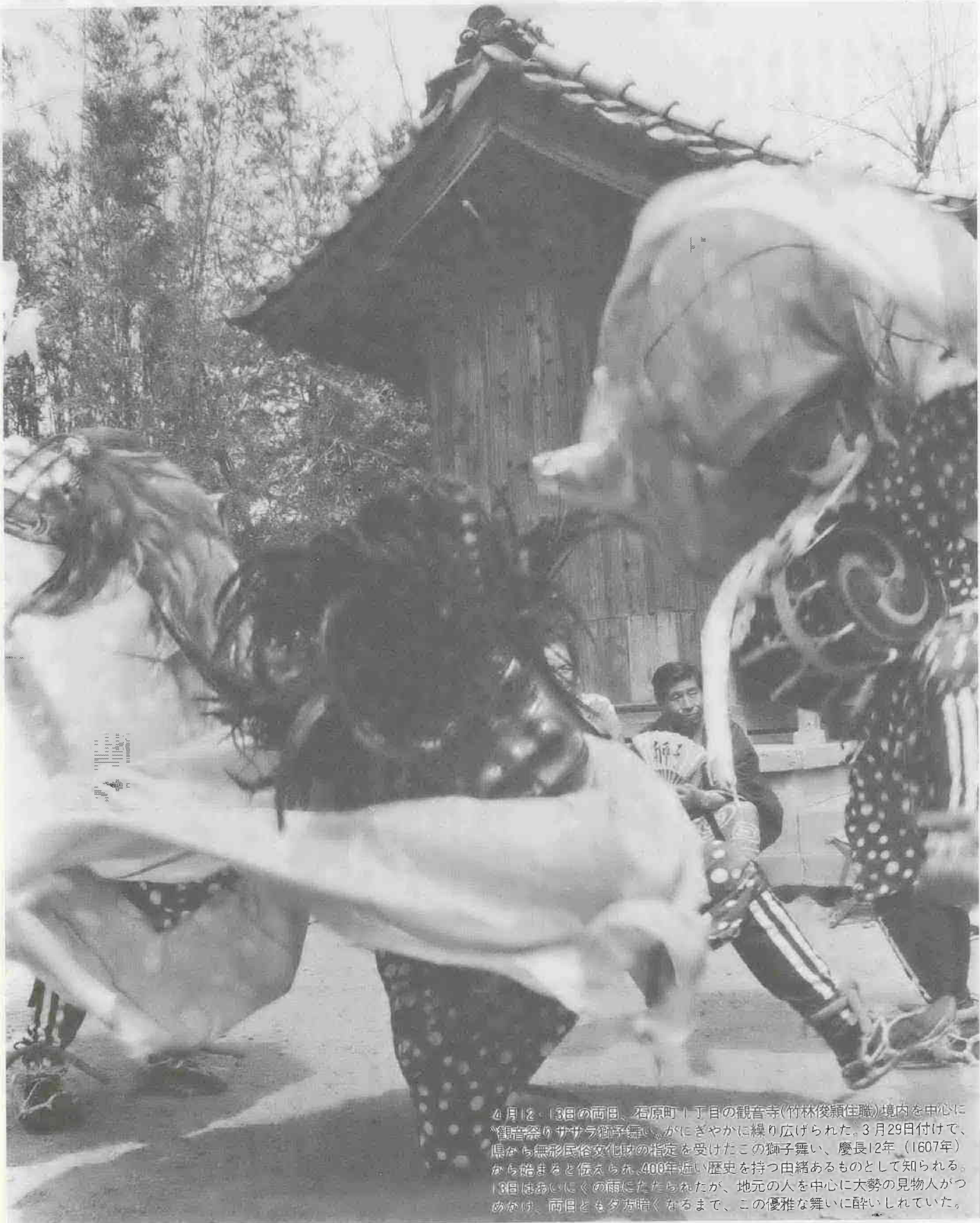
4月12、13日の両日、石原町1丁目の観音寺(竹林俊頼住職)境内を中心に「観音祭りサカラ獅子舞い」がにぎやかに繰り広げられた。3月29日付で、県から無形民俗文化財の指定を受けたこの獅子舞い、慶長12年(1607年)から始まると伝えられ、400年近い歴史を持つ由緒あるものとして知られる。13日は弱いにく雨にたたられたが、地元の人を中心に大勢の見物人がつめかけ、両日とも夕方暗くなるまで、この優雅な舞いに酔いしれていた。