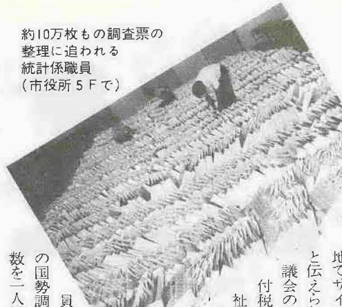
約10万枚もの調査票の整理に追われる統計係職員(市役所5Fで)