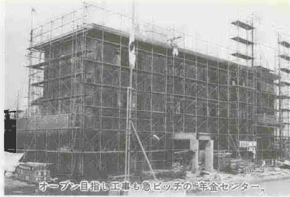
オープン目指し工事も急ピッチの年金センター。

緑の伊佐沼に 保養センターオープン 川越の景勝地、緑の伊佐沼。そのほとりでは、国民年金保養センター「むさしのが、十一月七日日のオープンを目指し建設を急いでいます。現在、同保養センターで働く職員を募集中です。