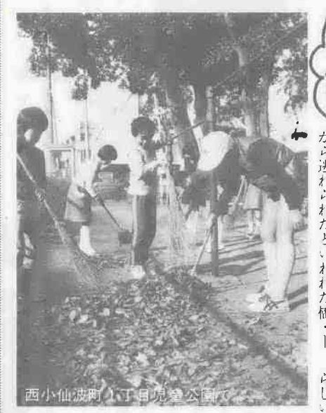
西小仙波町二丁目児童公園で

青少年はぐくむ 子供たちの活動は、社会生活の基礎となる。青少年の健全な成長を促すためには、身近でできる活動が大切である。