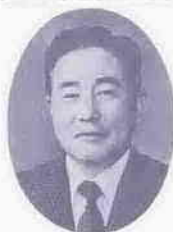
市長 岡島 和夫

霞ヶ関地区の大字鯨井及び的場の各一部(日本油脂跡地を含むその附近)を、住宅・都市整備公団が宅地開発することに伴い、同地域に総延長、汚水管二、五九六メートル、雨水管九一六メートルの公共下水道を敷設するため、その工事の委託契約を締結したものです。