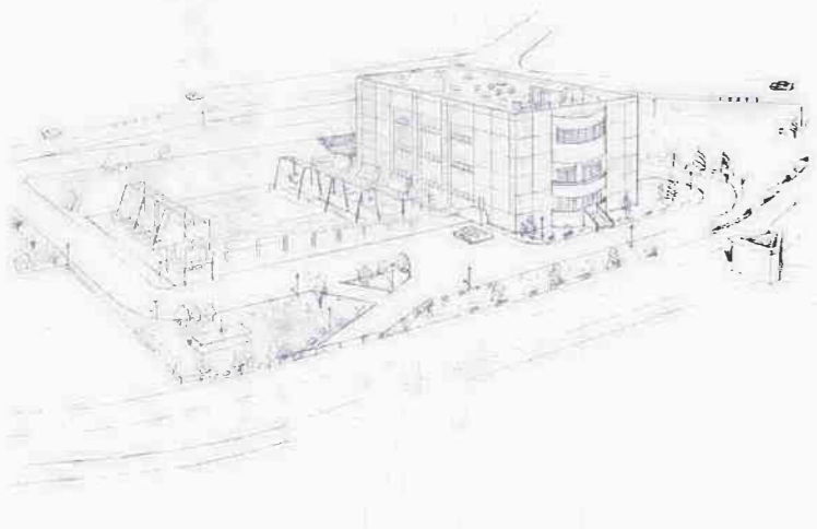
ポンプ場完成予想図

▽川越市霞ヶ関第一ポンプ場建設工事委託契約について — 原案可決— 霞ヶ関的場地区県道川越日高線沿いの一九七ヘクタールの地域の雨水浸水解消を図るため、ポンプ場を建設しようとするものです。 一、契約の方法 随意契約 二、契約の金額 一六億五千万円の範囲内 三、契約の相手方 東京都港区虎ノ門 日本下水道事業団 四、工期 本契約締結の日から昭和六十四年三月三十一日