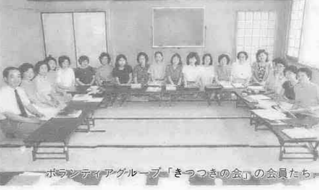
ボランティアグループ「きつづきの会」の会員たち

「もう一人の友だちのために」 「飢えに苦しむアフリカを救おう」 「もう一人の友だちのために」 「飢えに苦しむアフリカを救おう」 「もう一人の友だちのために」 「飢えに苦しむアフリカを救おう」