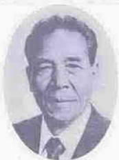
副議長 宇津木 克雄