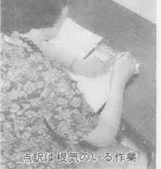
点訳は根気のいる作業

「視力障害者の気持ちを理解しながら点訳するように心がけています。」「自分で打ったものを読んでいただけるのが一番うれしいですね。」