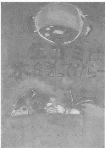
キッチンと水を切ればみんなが快適に...