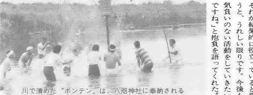
川で清めた「ボンテン」は、八咫神社に奉納される

昭和五十年、市主催の点訳講習会を受講したメンバーが、南公民館を借りてグループ作りを開始した。この年の四月、点訳技術の向上と親睦を図ることを目的に結成。県立図書館の岩崎英正先生を相談役に置き、三十九名からスタート。現在、主婦を中心に四十三名の団体が、自宅で点訳に