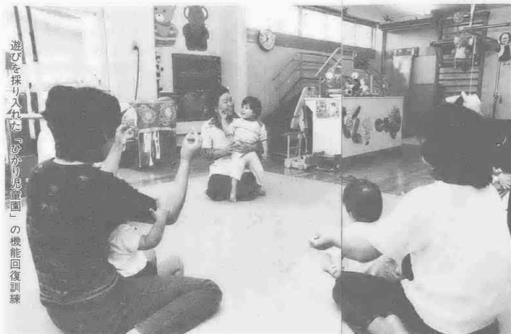
遊びを探り入れた「ひかり児童園」の機能回復訓練

子どもたちが事故なく、楽しい夏休みを過ごすことができるように、次のような子どもを見かけたら、愛と勇気の心をもって、ひと