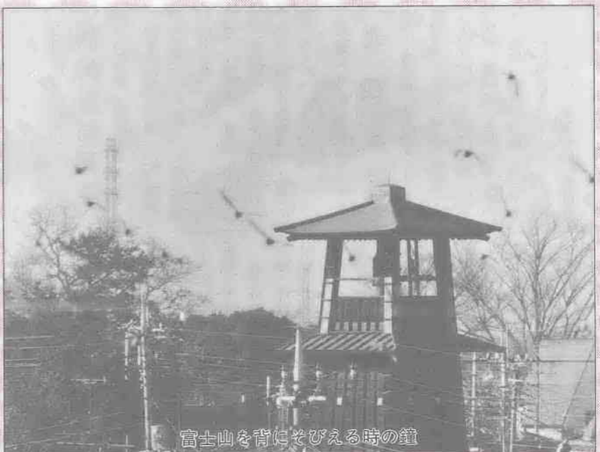
富士山を背にそびえる時の鐘