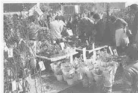
農業感謝祭のイベントの一つ、昨年の「花と植木の展示即売会」から

市内のさまざまな農業関係機関などの協力で、大イベントに「変身」した「川越市農業感謝祭」が開催されます。