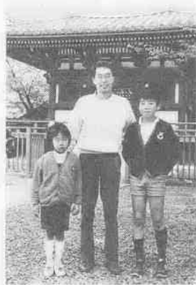
「川越は歴史のまち。そして来るたびに発見が…」

「観光客ではありませんが、毎年各国から百人を越す留学生が川越で勉強しています。相当の数の留学生が日本と川越の思い出を胸に帰国し、活躍しているはずですが、日本の文化を理解しようとする者には、川越は素晴らしいところなんです。東京近くにあつて、古いものがこんなに残っている、それに親切な人が多い……。」