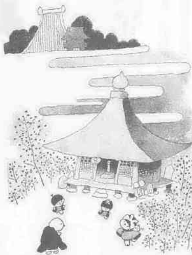
さし絵・文 池原昭治氏