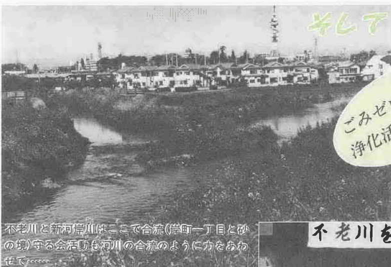
不老川と新河岸川はここで合流(岸町一丁目と砂の境)守る会活動も河川の合流のように力をあわせて