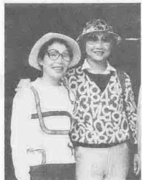
「住んでいる人が、まちを大切にしている…」

「川越は車で通ったことはいませんが、見学するのは初めてです。見学の通りに通っています。