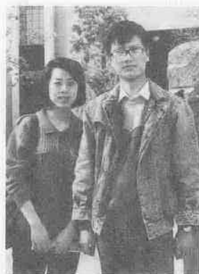
「川越をもっと知りたい。帰国後も思い出のまちに…」