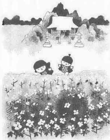
さし絵・文 池原昭治氏