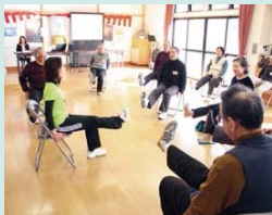
健康体操教室「ハピネス」