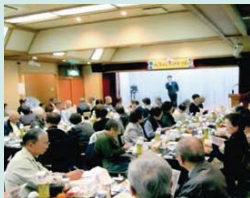
一人暮らし高齢者の集い