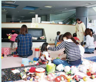
子育てサロン「かんがる～」