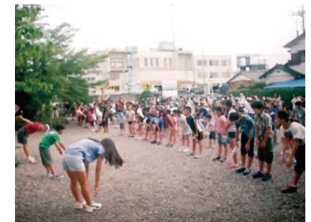
地区のラジオ体操の様子