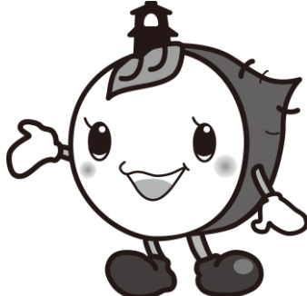
川越市マスコットキャラクター ときも

調査にご協力いただきまして、ありがとうございました。 切手は貼らずに同封の封筒に入れ、ご投函ください。