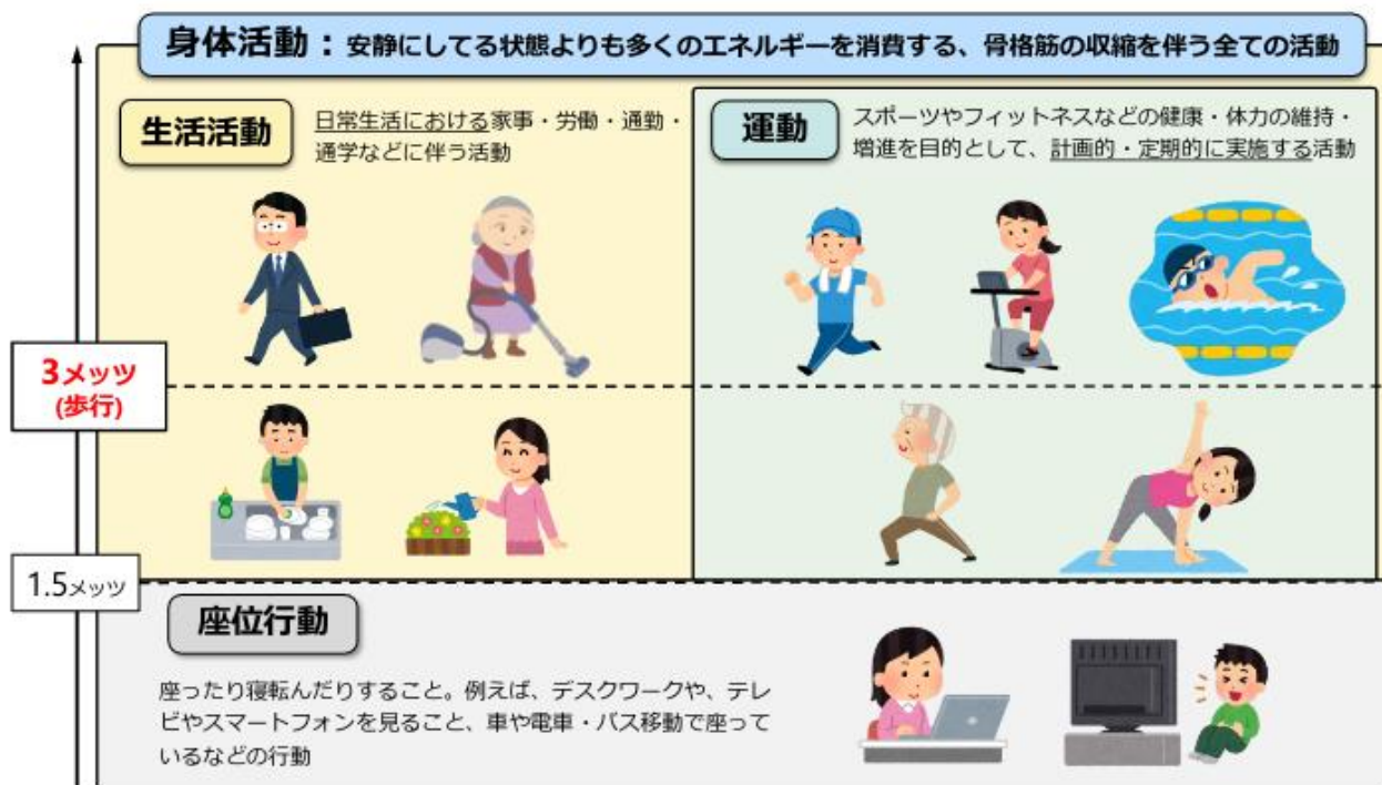
図1：身体活動（生活活動・運動・座位行動）の概念図