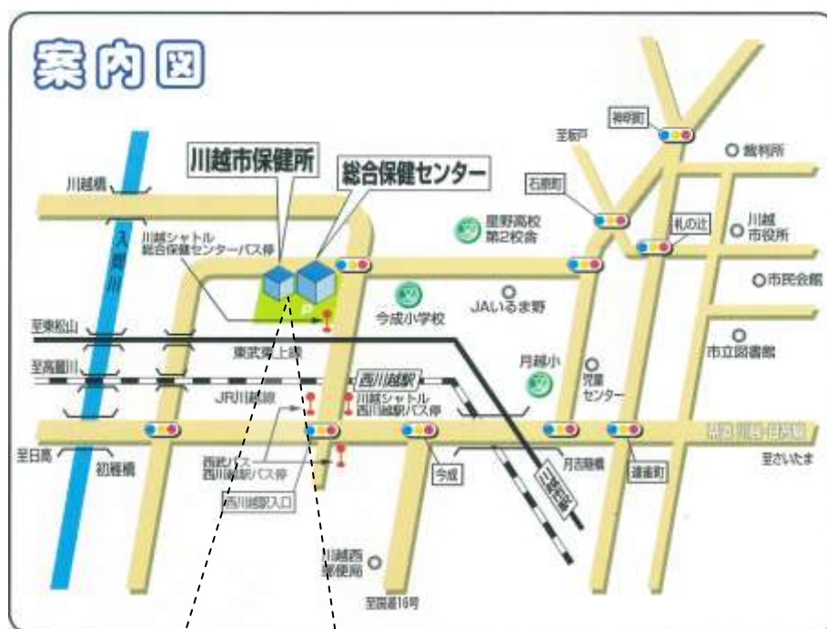
駐車場入口拡大図