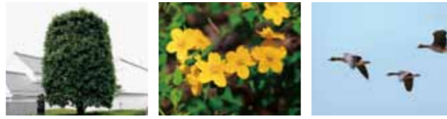
市の木 「かし」 市の花 「山吹(やまぶき)」 市の鳥 「雁(かり)」