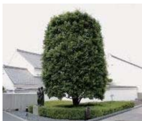
■市の木 かし (昭和 57 年制定)