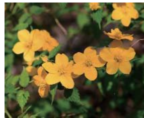
■市の花 山吹 (やまぶき) (昭和 57 年制定)