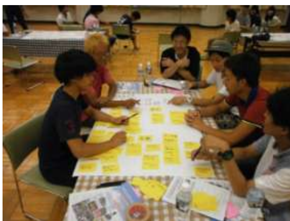
グループワークでの話し合いの様子