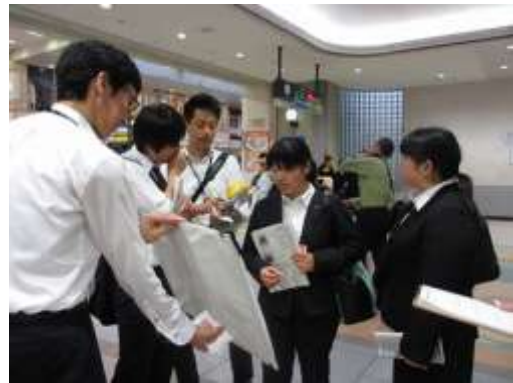
インタビューの様子