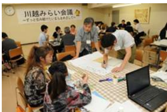
グループでの話し合いの様子