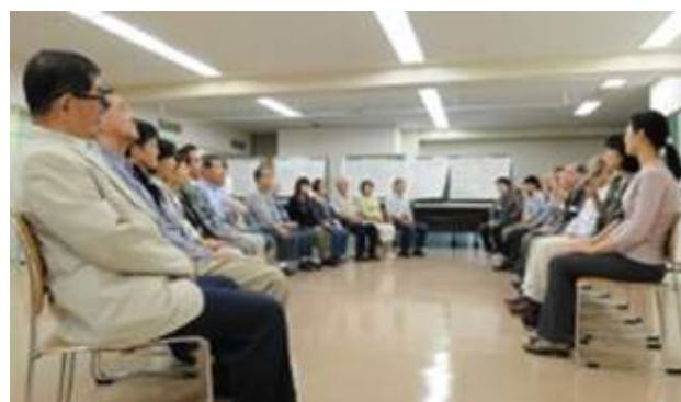
全体での振り返り 全参加者が意見・感想等を述べている。