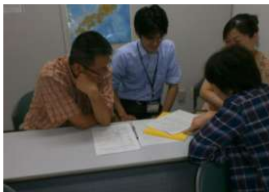
インタビューの様子