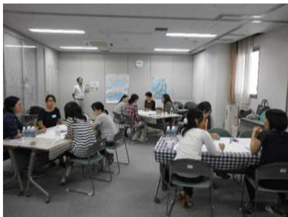
グループでの話し合いの様子