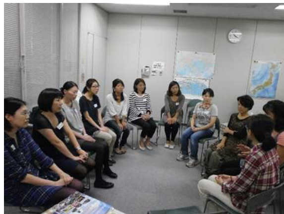
全体の振り返り 参加者が意見や感想を述べている