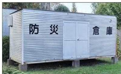
▲防災倉庫 (簡易トイレ・応急救護用品・食糧等備蓄)