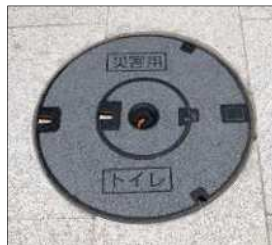
▲マンホールトイレ