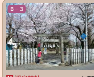
11 浮島神社 久保町