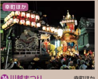
36 川越まつり 幸町ほか