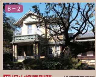
49 旧山崎家別邸 松江町二丁目