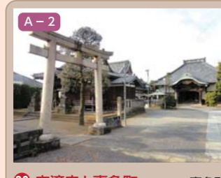
30 広済寺と喜多町 喜多町