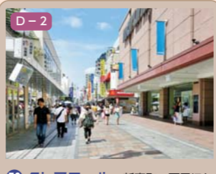
50 クレアモール 新富町一丁目ほか