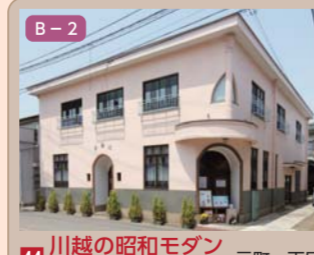
44 川越の昭和モダン太陽軒 元町一丁目