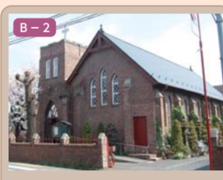
5 松江町の教会 松江町二丁目