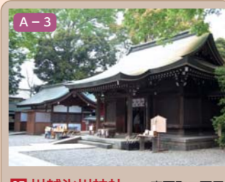
35 川越氷川神社 宮下町二丁目