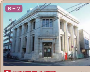
2 川越商工会議所 仲町