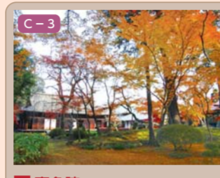
13 喜多院 小仙波町一丁目