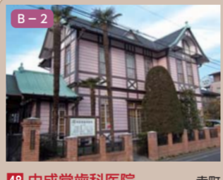
48 中成堂歯科医院 幸町