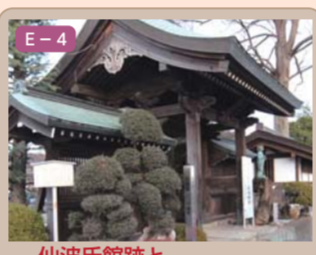
20 仙波氏館跡と新河岸川 仙波三丁目ほか