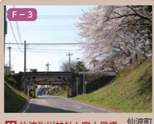
16 仙波水川神社と富士見橋 仙波町四丁目