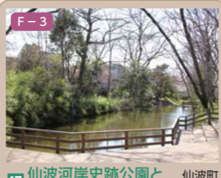
17 仙波河岸史跡公園と愛宕神社 仙波町四丁目