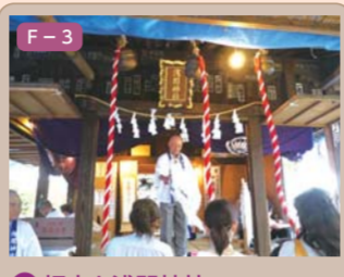
18 初山と浅間神社 富士見町