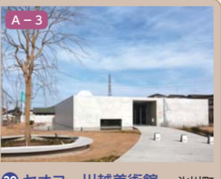
39 ヤオコー川越美術館 氷川町