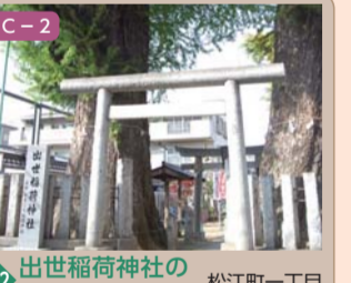
42 出世稲荷神社の大イチョウ 松江町一丁目