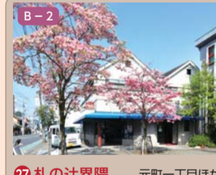
27 札の辻境界 元町一丁目ほか