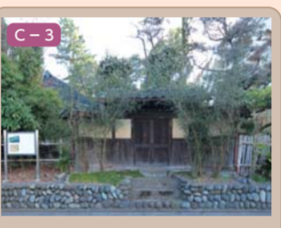
10 永島家と七曲り 三久保町