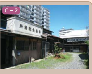
9 旧川越織物市場 松江町二丁目