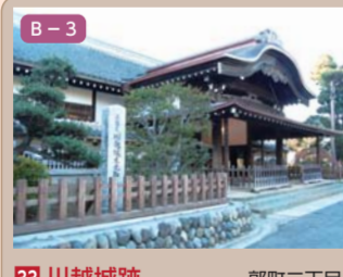
33 川越城跡 郭町二丁目