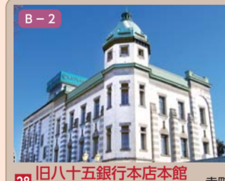
28 旧八十五銀行本店本館(埼玉りそな銀行川越支店) 幸町