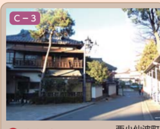
4 喜多院の西境界 西小仙波町一丁目