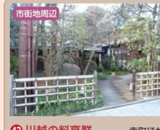
43 川越の料亭群 幸町ほか