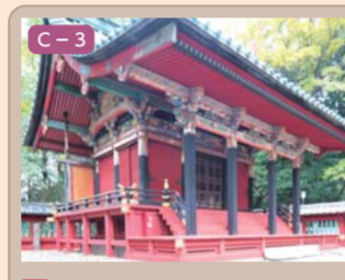
14 仙波東照宮 小仙波町一丁目