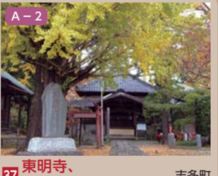
37 東明寺、河越夜戦跡と門前 志多町