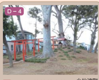
19 三変福荷神社古墳 小仙波町四丁目