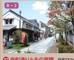
32 寺町通りとその境界 仲町ほか