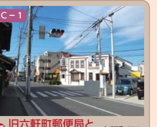
25 旧六軒町郵便局とその境界 六軒町ほか