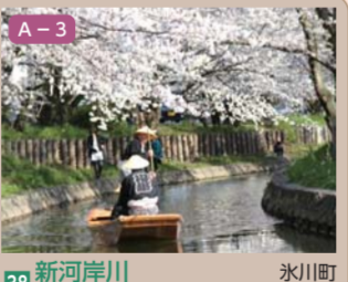
38 新河岸川(田谷堰から宮下橋にかけて) 氷川町ほか