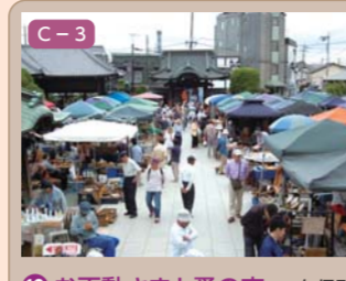
12 お不動さまと蚤の市 久保町