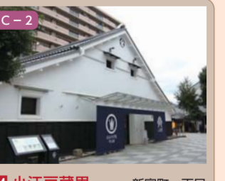
24 小江戸蔵里 新富町一丁目