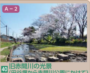
40 日赤間川の光景(田谷堰から赤間川公園にかけて) 宮元町ほか