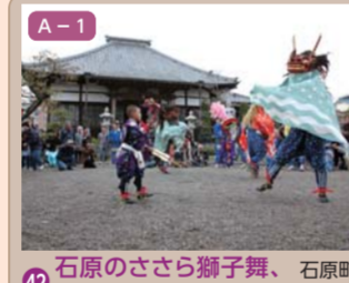
42 石原のささら獅子舞、観音寺と本応寺 石原町一丁目