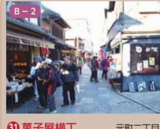
31 菓子屋横丁 元町二丁目