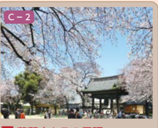
8 蓮馨寺とその境界 連雀町