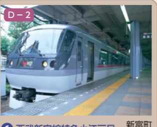
6 西武新宿線特急小江戸号 新富町一丁目