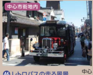
46 レトロバスの走る風景 中心市街地内