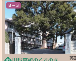
41 川越高校のくすのき 郭町二丁目