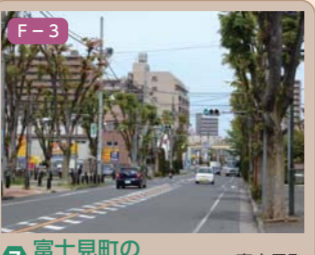
7 富士見町の川越街道ケヤキ並木 富士見町