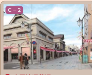
3 大正浪漫夢通り 連雀町・仲町