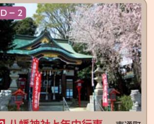
23 八幡神社と年中行事 南通町