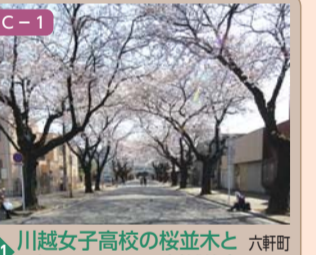
21 川越女子高校の桜並木と六軒町のカトリック川越教会 六軒町一丁目