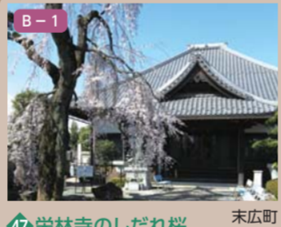
47 栄林寺のしだれ桜 末広町一丁目