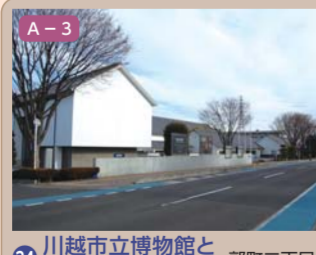
34 川越市立博物館と美術館 郭町二丁目