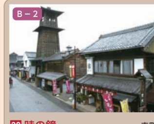
29 時の鐘 幸町