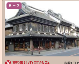
26 蔵造りの町並み 幸町ほか