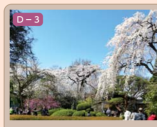
15 中院の四季 小仙波町五丁目