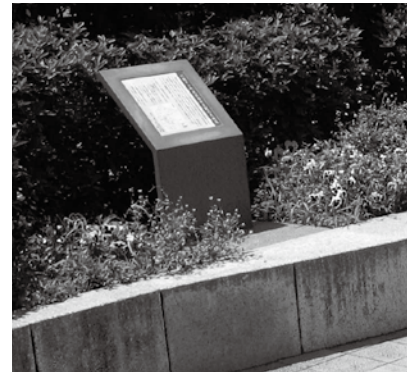
案内板(連雀町のふれあいアベニュー)

連雀町のふれあいアベニューは、平成 21 年に「中央通り周辺地区」が都市景観形成地域に指定されたことに伴い、隣接する地区から当地区に編入されたため、盤面の内容を変更しました。