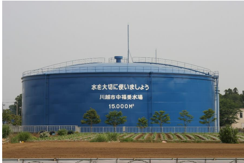
(川越市中福受水場配水池)

川越市では、市民の皆様へお届けしている水道水の安全性を確かめるために、検査項目、検査頻度及び公表方法等を定めた「水質検査計画」を毎年策定し、水質検査を行っています。