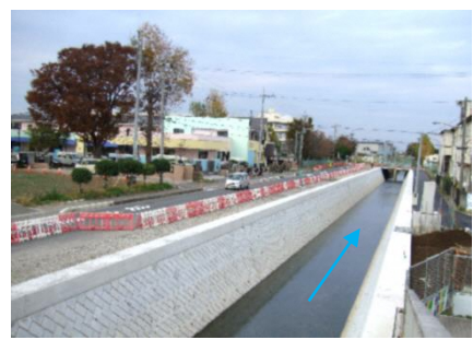
公開イメージ(江川流域都市下水路)