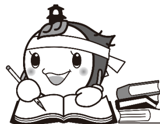
川越市マスコットキャラクターときも