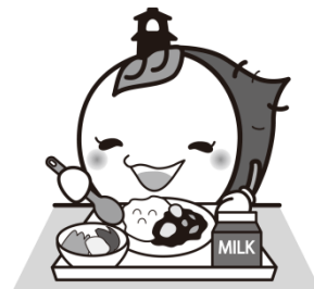
川越市マスコットキャラクターときも