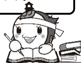
川越市マスコットキャラクター ときも

採用試験の費用には市民の皆さまの貴重な税金が使われております。 試験を申し込まれる方は 必ず受験されるよう お願いいたします。