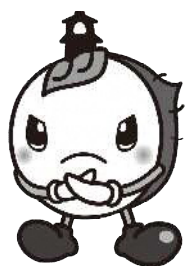
川越市マスコットキャラクター ときも