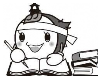
川越市マスコットキャラクター ときも

採用試験の費用には市民の皆さまの貴重な税金が使われております。 試験を申し込まれる方は 必ず受験されるよう お願いいたします。