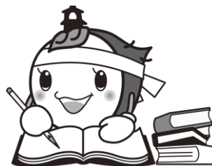
川越市マスコットキャラクター ときも