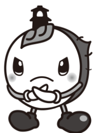
川越市マスコットキャラクター ときも

集合時刻は厳守してください。 集合時刻に遅れた場合は、 電車の遅延証明書がある場合を除き、 受験できません。