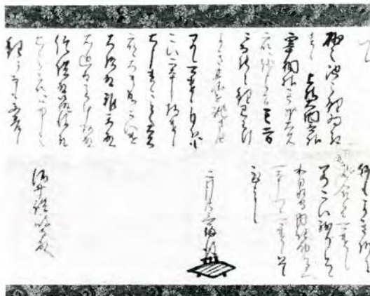
酒井忠利書状(切紙)

以上 砂之池之鯉為取遣候。上様・大納言様・宰相様其外大名衆へ越申候間、其方ニ而能く鯉見わけよき臺を誂させ早々可遣候。自分へもこい二本指遣候。右申遣候とこく大名衆へ大キ成こい遣。大炊殿・雅楽殿・右近殿・主計頭殿・信濃殿・筑後殿右之衆へハ中之鯉ニ而も不苦候。何もよき様に見合候而可遣候。若こい残り申候ハ、和泉守・内記助かたへ一本ツ、可遣候。恐々謹言。 二月廿三日 備後(花押) 酒井謙政守殿