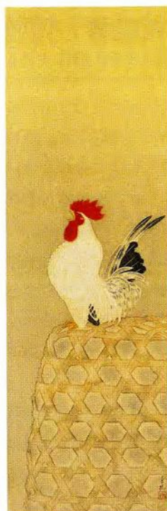
小茂田青樹 鳴鶏 (1931年頃)