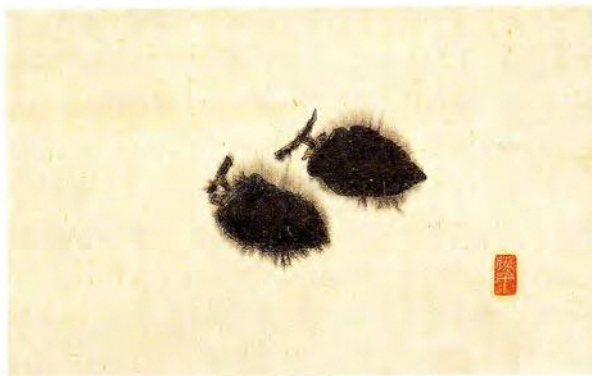
岩崎勝平 双柿図 (1950年頃)