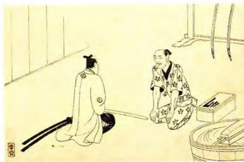
小村雪岱 忠臣蔵 (1935年～1940年)

泉鏡花の文学に傾倒し、鏡花の作品の装丁を手がけました。「雪岱」の雅号も鏡花から送られたものです。