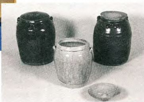
幸町旧小山家出土陶磁器