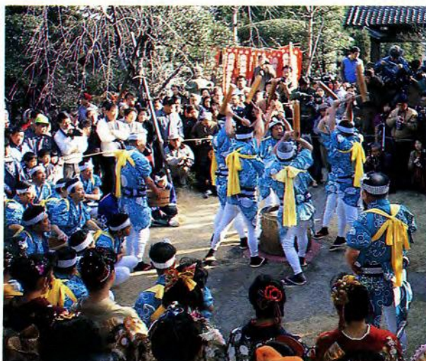
南大塚の餅つき踊り

平成7年1月5日(木)午前9時から市立博物館で受付をおこないます。(電話可)定員は先着30人で、市内在住か在勤の方に限らせていただきます。