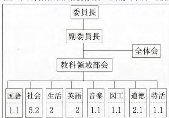
(図1)「博物館利用研究委員会の組織」(平成6年度)

さらに、研究の成果を各学校に広めるための手だてとして、博物館活用の手引「やまぶき」を発行し市内の全ての先生方に配布するとともに、博物館活用指導者研修会で研究内容の発表を行っています。