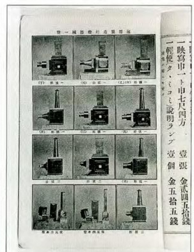
四世池田都楽「幻燈器械映画定價表」