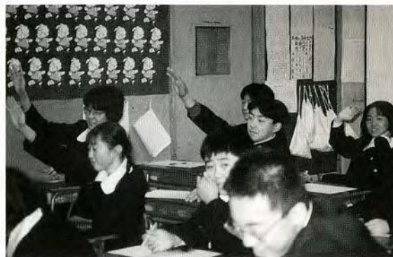
高階中学校の授業風景