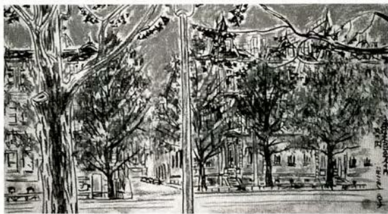
東京百景の内 丸の内