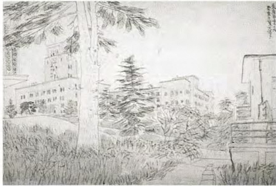
東京百景の内 東京工業大学 (個人蔵)