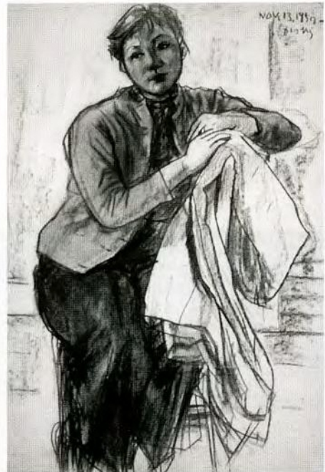
女十二題の内 赤い服の婦人 (個人蔵)

部の識者から高く評価されましたが、健康上の理由もあってシリーズとしての完成をみることなくおわります。