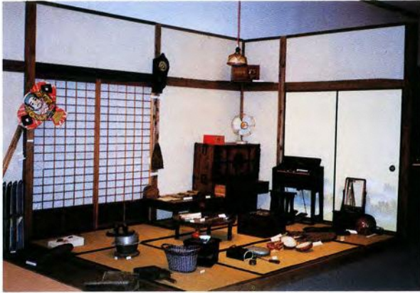
子供のいた部屋の再現