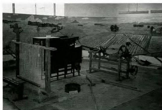
展示室内のようす（牛子小学校）

している。立体的展示としては農家の縁側を再現し、雰囲気づくりをしている。中央には農家の中庭で作業を行なう道具等を展示し、農家の仕事の内容が多角的に理解できるように工夫している。表示は少なくし、解説パネルは一カ所に設置した。展示制作にあたっては、地域の父兄や美術専攻の学生の協力を得てある程度のグレードのジオラマとなった。