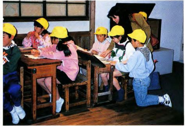
昔の教室を体験する古谷小学校の児童