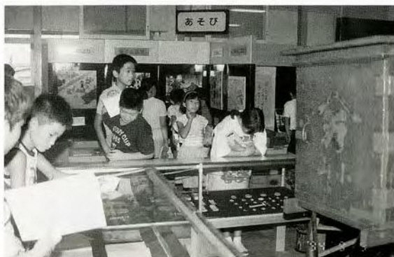
郷土資料室を活用して学習する子供たち(寺尾小学校)

寺尾小学校では昭和62年ごろ、児童数の減少によりいくつかの転用可能教室が生じてきた。そこで、郷土資料室を設置し、より児童の学習に生かしたいとの学校からの要望があった。そして、学校と協議しながら展示室の構成を設定していった。