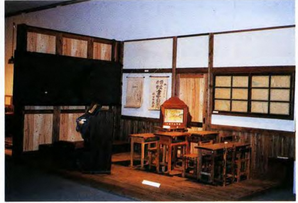
木造校舎の教室の再現