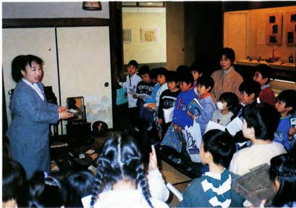
道具の使い方を聞く霞ヶ関西小学校の児童