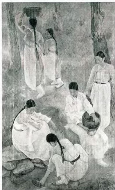
薬水を汲む (当館蔵)

昭和16年春、先輩画家の娘と結婚しましたが、その新婚生活はあまり幸せなものではなかったらしく、半年程して事故で亡くなります。この新妻の死がその後の人生に非常に大きな影響を与えました。