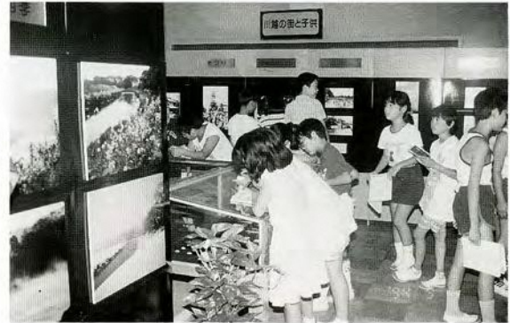
郷土資料室を活用して学習する子供たち(寺尾小学校)

検討の結果「民話の世界と新河岸川」がテーマとなった。1年から6年までの国語の教科書にみられる民話をテーマに、子供たちの国語の理解の一助となるようにすること。さらに、この地域は古くから新河岸川を使った舟運が盛んであった。そこで、これらに関連したテーマを設定することで、子供たちが地域を学ぶ機会となるようにとの配慮からであった。