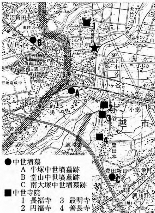
第1図 堂山中世墳墓跡と周辺の中世遺跡

3は常滑系甕の破片。頸部が内傾して立ち上がり、口縁部は大きく開いて端部を摘み出す。口径21.9cm。粘土紐輪積み成形。内部には輪積み痕、