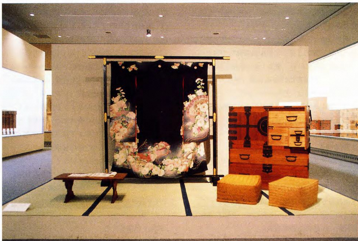
収蔵品展展示室内