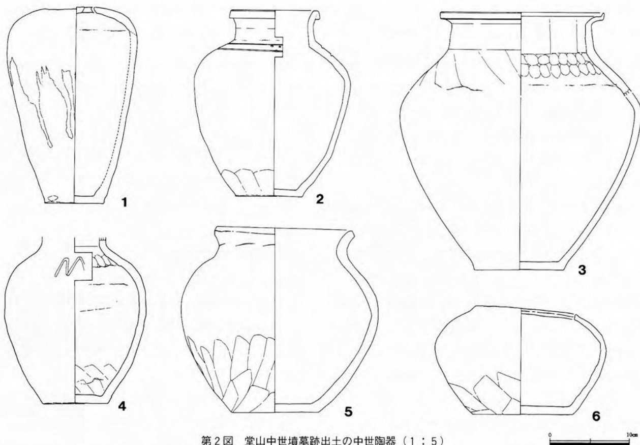
第2図 堂山中世墳墓跡出土の中世陶器（1：5）

指頭圧痕が残る。内面は篋撫で、外面篋削り。胎土は小石、長石粒を含む。焼成良好で暗茶褐色。