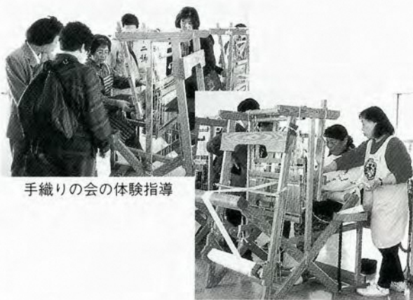
手織りの会の体験指導

同好会による組織的な体験指導ボランティアが始まって1年余り経過しました。機織り体験をされた来館者の様々な喜びの声を聞くにつけ、市内外からボランティアに来て下さる会員の皆様に深く感謝申し上げるとともに、市民参加型の博物館運営の重要性を再認識し、さらに努力していきたくと思います。