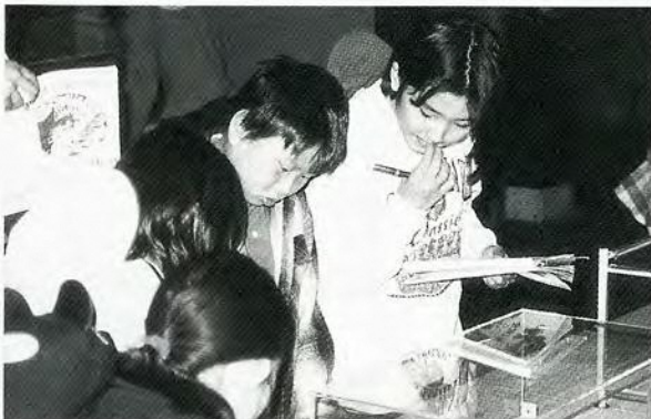
博物館での学習の様子