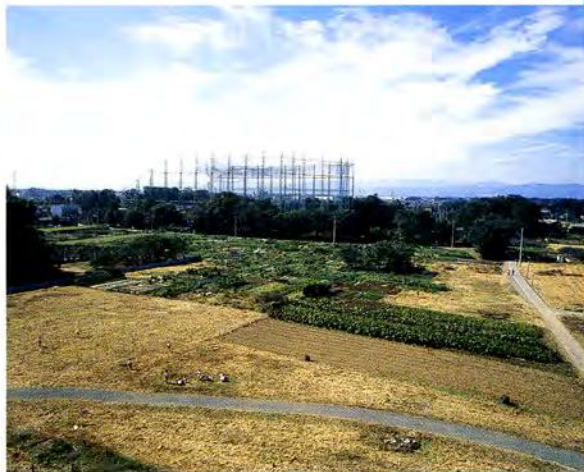
上戸小学校屋上より河越館跡を望む