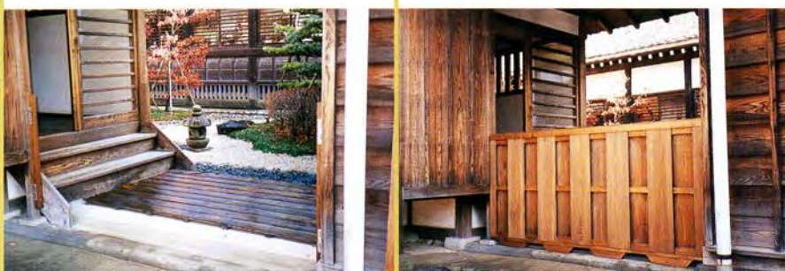
渡り廊下（板塀取り付け前・後）

御来館いただいた皆様に、より快適に御見学いただけるよう、今後も様々な面で改善を心掛けていきたいと思えます。