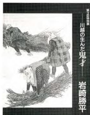
第3回特別展 川越の生んだ鬼才 岩崎勝平