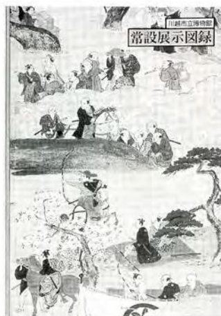
川越市立博物館 常設展示図録