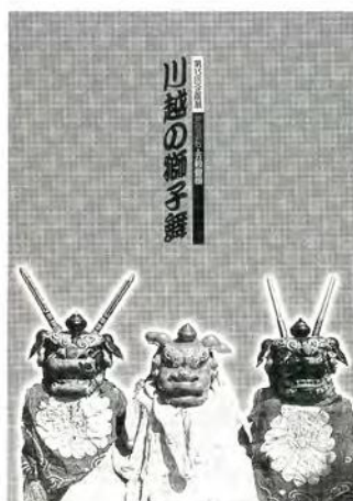
第15回企画展 悪疫退散・五穀豊穣 川越の獅子舞