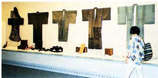
「着る」「食べる」コーナー

「着る」では、町場の装いとして普段着、婚礼衣装、火事装束、子供の祝い着などを紹介しました。