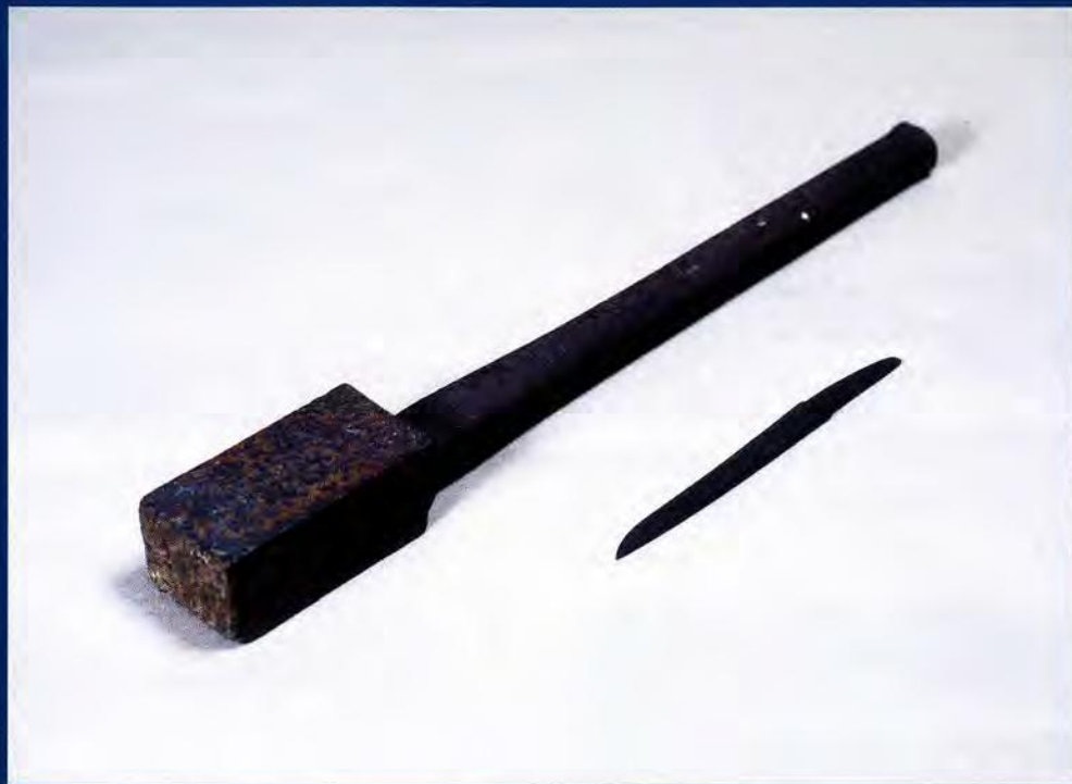
正木英辰の槌子棒・短刀(荒仕上げ品)