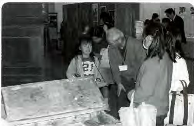
子どもに語りかける学習アドバイザー