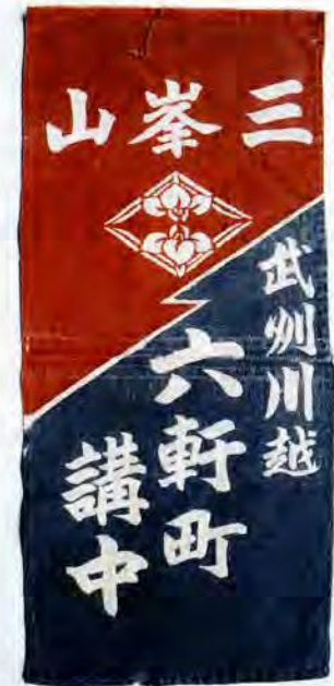
マネキ(講中の標識となる旗)