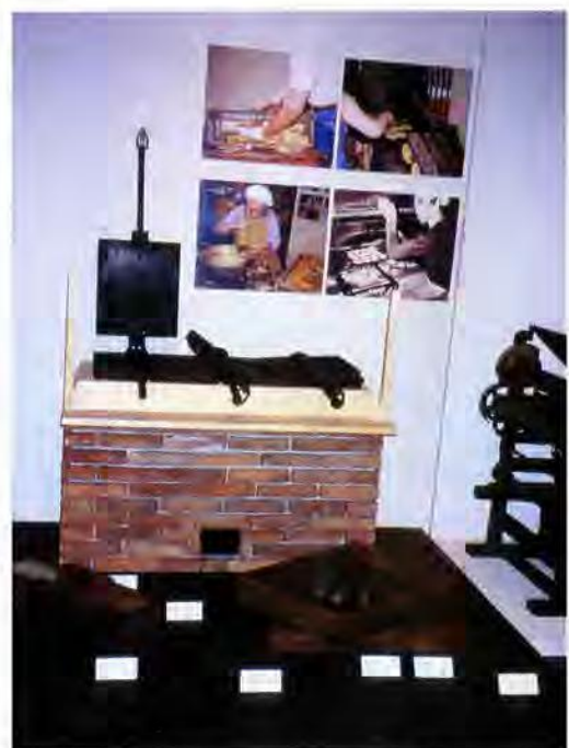
「いもせんべい」のかまどの再現