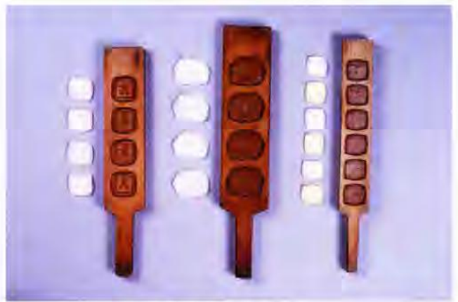
打ち物(落雁)の木型

明治44年(1911)の『川越商工案内』には、「当町菓子商は其数頗る多く、単に附近の需要を充たすのみならず、他地方へ輸送するもの亦少なからず。近來は西洋菓子をも製出して、其風味中央都会に譲らざるものあり」とあり、当時の様子を如実に伝えています。この頃になると、江戸時代以来の和菓子に加え、川越の菓子屋にもマシュマロやビスケットなどが登場しました。一方で、この地方の名産であったさつまいもを使ったお菓子も作られ始めました。このような川越独自のお菓子は、当初はお参りや観光などで川越を訪れる人々のおみやげとして広まったようです。今回の収蔵品展では、現在川越名物として