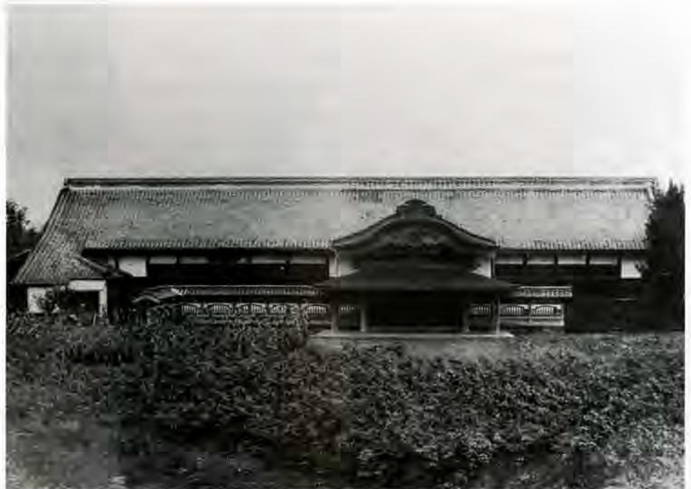
入間郡公会所として使われていた頃の本丸御殿(明治41年頃)