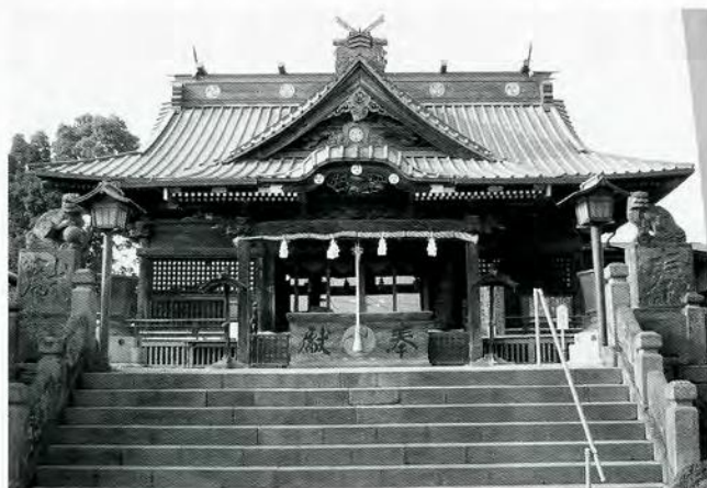
雷電神社社殿

展示の準備が始まった当初、講の実態がつかめず、現在でも活動が続けられているだろうか、信仰用具が保存されているのだろうかと思うことがたびたびありました。しかし古市場のように、地区によっては現在でも様々な信仰行事が続けられていることがわかりました。人々の信仰は、代参に自動車を利用するなど、現代の生活に合うよう形態を変えて生き残ってきたのです。調査先で出会った人々の熱心な信仰心に、私はあらためて驚きました。唯一残念だったのは、調査期間が短く、全地区について詳しく調べることができなかった点です。これからの課題としたいと思います。(取材 石川みな)