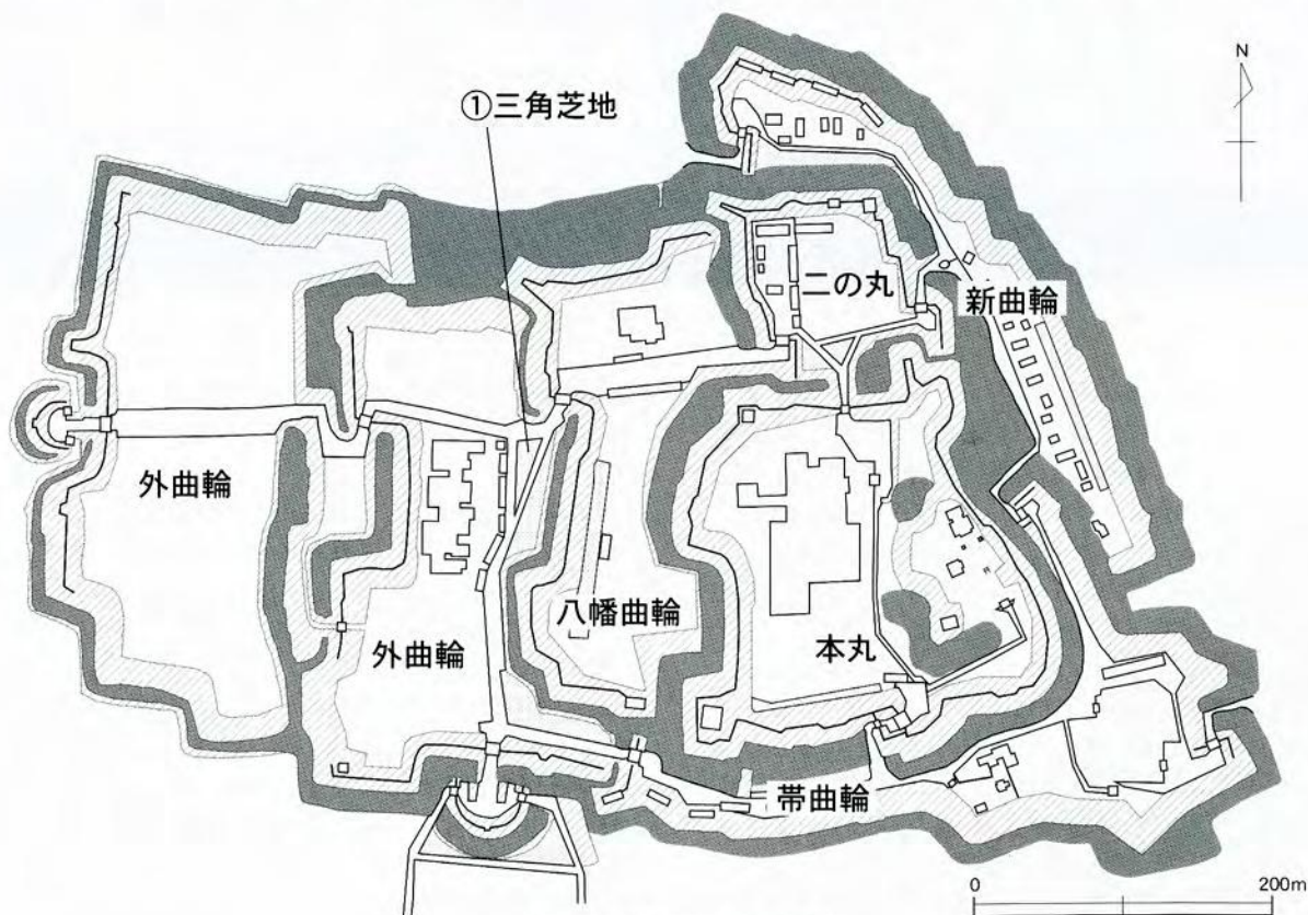
第1図 近世川越城の縄張り

享徳3年(1454)に成氏が憲忠を殺害したため、幕府は上杉方に援軍を送り、成氏を鎌倉から追放し、成氏は翌年6月に下総古河へ落ち、「古河公方」となります(享徳の乱)。この戦乱の中で、顕房が戦死したため、持朝は扇谷家の当主として復権し、長祿元年(1457・注2)川越城