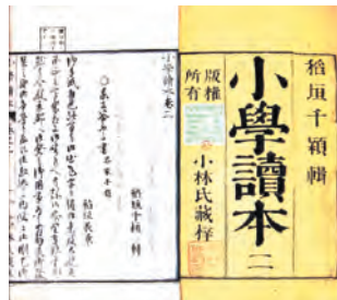
〔資料6〕「小学讀本 二」 館蔵