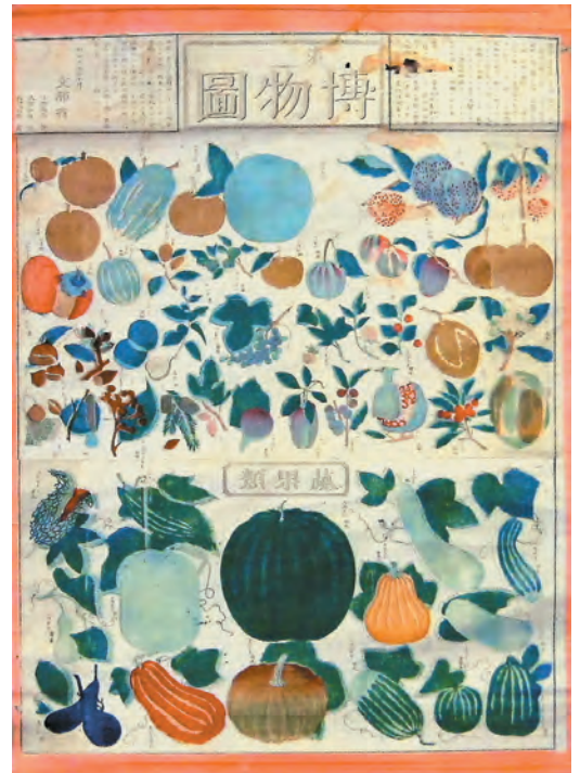
〔資料4〕「博物図 菓物類」(明治6年製) 館蔵

下等小学第5級の間答の授業で使用されていた地図の掛図です。「暗射」とは、地名などの表記がない地図を指します。