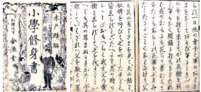
[資料2] 「小学修身書 四」 館蔵