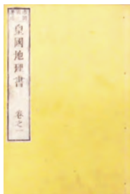
〔資料5〕「皇国地理書」 館蔵