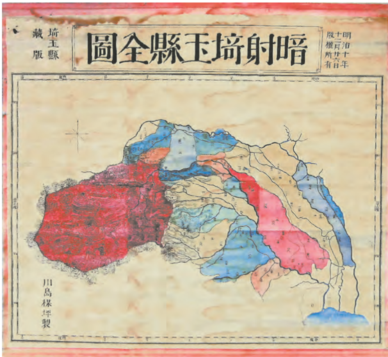
〔資料3〕「暗射埼玉縣全圖」(明治10年製) 館蔵

古我原学校は、明治11年(1878)に川越市古市場に開校されました。現在の南古谷小学校の学区になります。