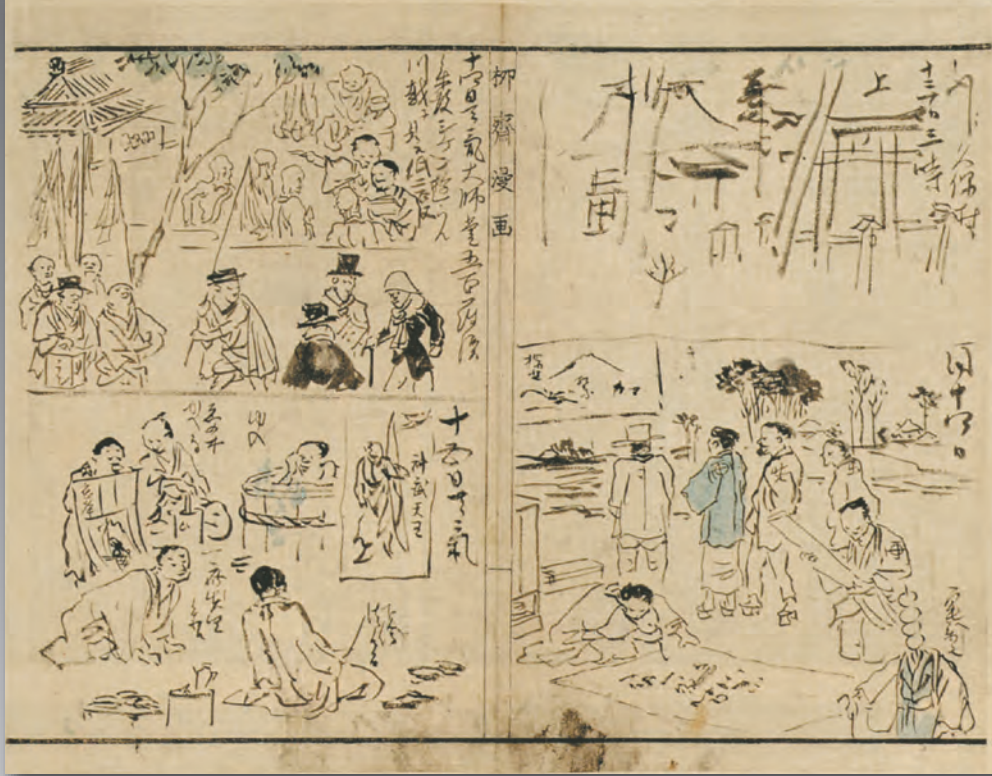
「狂齋画日記」(明治9年) 河鍋暁齋記念美術館蔵