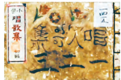
〔資料7〕「小学唱歌集 初編」 館蔵