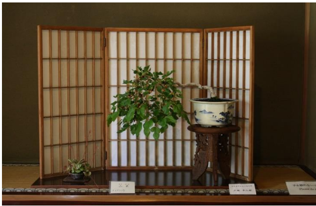
5月21日、22日 日本盆栽協会川越支部