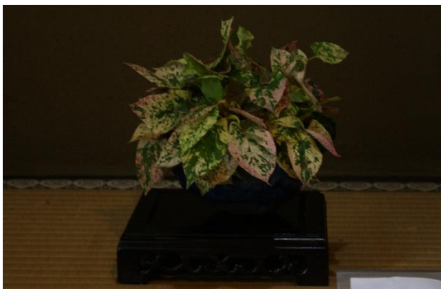
斑入りイタドリ（フィリイタドリ）