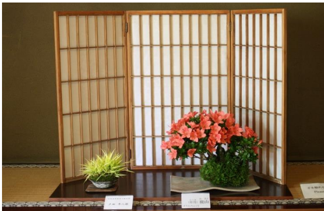
5月28日、29日 日本盆栽協会川越支部