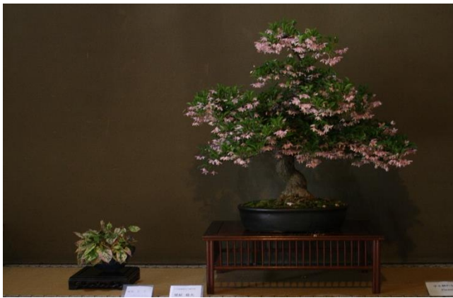
5月16日、17日 日本盆栽協会川越支部