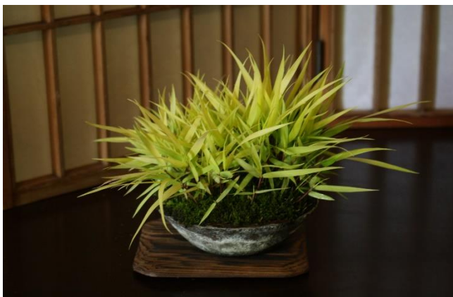
黄金風知草 (黄金フウチソウ)