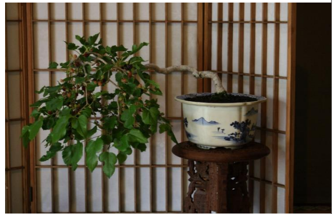
明月草 (メイゲツソウ)