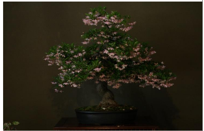
紅花エゴノキ（ベニバナエゴノキ）