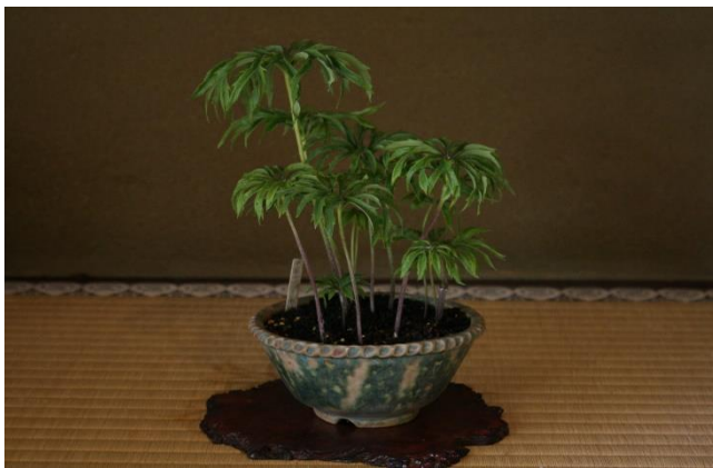
破れ傘（ヤブレガサ）