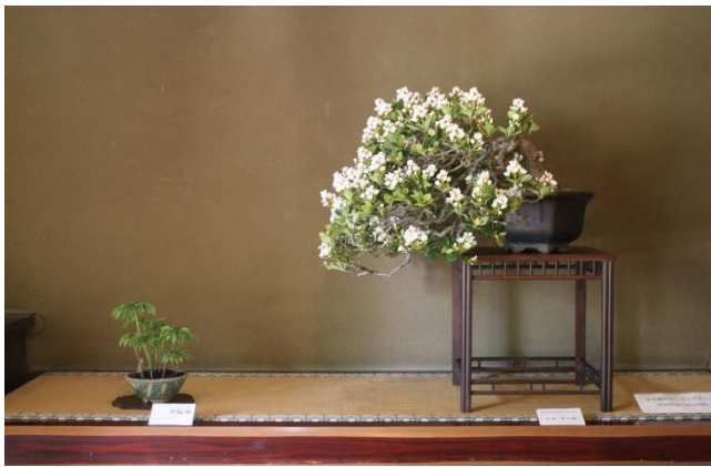
5月7日、8日 日本盆栽協会川越支部