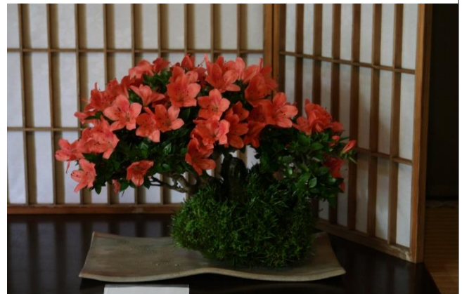
臯月鹿山 (サツキカザン)