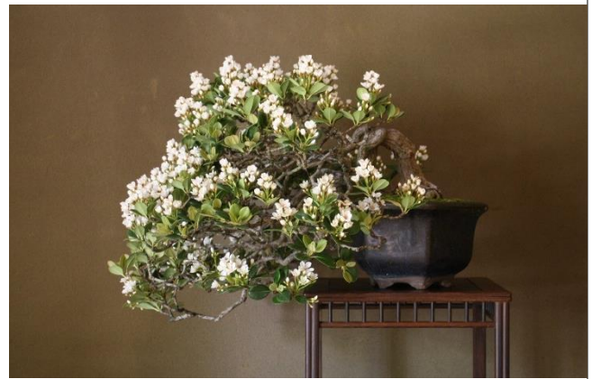
車輪梅（シャリンバイ）